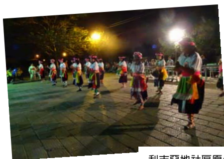
利吉惡地社區原住民熱舞迎賓。

此外，值此 0708 尼伯特颱風災害後各界關懷臺東之際，本活動不僅可深化全民對於國土永續管理之認同感，亦可喚起「擁抱臺東」的意識，展現對於大地的熱情，並對臺東地區觀光，促進地方經濟發展有所助益。