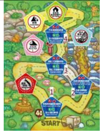
(上圖為所有磁鐵相對應擺放圖樣)

3. 再將五組鑰匙放置於左側箱面上，並將貼有 (R) 字樣的密碼鎖頭將遊戲箱上鎖，即準備完成。