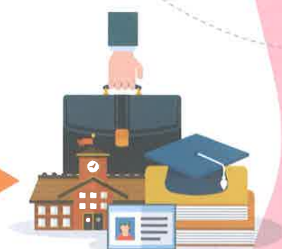
未來就學、就業或創業