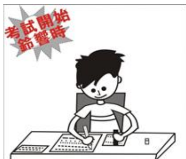
考試開始鈴響時，不必等監試人員宣布即可開始作答。