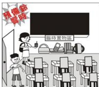
預備鈴響即可入場，非考試物品放置臨時置物區，迅速對號就座。