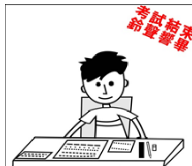
考試結束鈴聲響畢，應即停止作答。