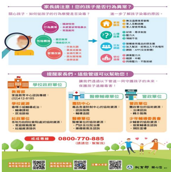
圖 1：防制藥物濫用宣導資訊